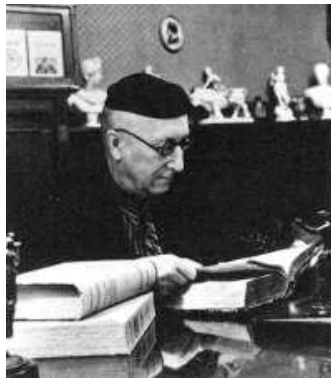
Алексей Лосев (1893-1988)