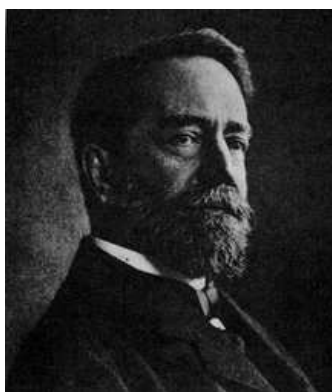
Феликс Клейн (1849 - 1925)

В 19-м веке выдающийся математик Феликс Клейн попытался объединить все ветви математики на основе икосаэдра, Платонового тела, дуального додекаэдра [86]. По существу исследования Клейна можно рассматривать как дальнейшее развитие так называемой «икосаэдро-додекаэдрической идеи», которая, начиная с Пифагора, Платона, Евклида и Кеплера, «красной нитью» проходит через всю историю науки. Клейн трактует икосаэдр, основанный на золотом сечении, как геометрический объект, из которого, по его мнению, вытекают ветви пяти математических теорий: геометрии, теории Галуа, теории групп, теории инвариантов и дифференциальные уравнения . Главная идея Клейна предельно проста: "Каждый уникальный геометрический объект так или иначе связан со свойствами икосаэдра". К сожалению, эта замечательная идея не получила развития в современной математике, что является еще одной «стратегической ошибкой» в развитии математики. Развитие этой идеи могло бы повлиять на структуру математической науки и привело бы к объединению многих важных разделов математики на основе икосаэдра, основанного на «золотом сечении».