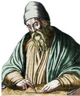
Евклид (около 325 до н.э. - около 265 до н.э.)

Как известно, «Начала» Евклида являются главным трудом греческой науки, посвященным аксиоматическому построению геометрии. Такой взгляд на «Начала» наиболее распространен в современной математике.