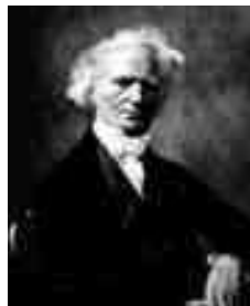
Бине (1786 – 1856)

В 19 в. в развитии теории «золотого сечения» было сделано важное математическое открытие. Речь идет о так называемых « формулах Бине », выведенных французским математиком Бине в 19-м веке.