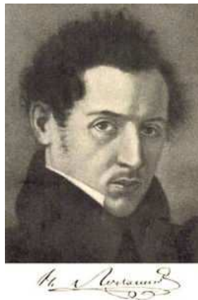
Николай Лобачевский (1792 – 1856)

В этом высказывании Колмогоров подметил одну особенность математиков – стыдливое отношение к «началам» математической науки, а точнее - пренебрежение «началами» («на разных ступенях обучения и с разной степенью смелости»). Задолго до Колмогорова на эту тенденцию в развитии математики обратил внимание Николай Лобачевский. Высказывание Лобачевского по поводу «пренебрежения началами» взято в качестве эпиграфа настоящей статьи.