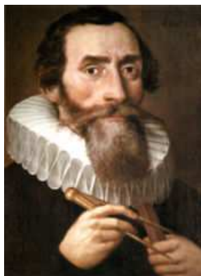
Иоганн Кеплер (1571-1630)