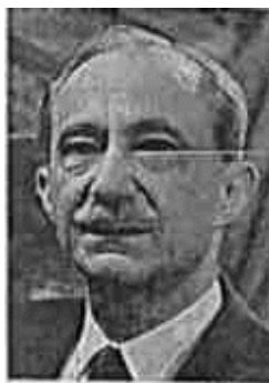
Морис Клайн (1908-1992)