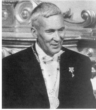
Андрей Колмогоров (1903 – 1987)

В этом высказывании Колмогоров подметил одну особенность математиков – стыдливое отношение к «началам» математической науки, а точнее - пренебрежение «началами» («на разных ступенях обучения и с разной степенью смелости»). Задолго до Колмогорова на эту тенденцию в развитии математики обратил внимание Николай Лобачевский. Высказывание Лобачевского по поводу «пренебрежения началами» взято в качестве эпиграфа настоящей статьи.