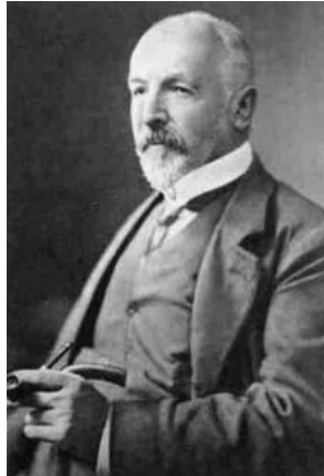
Георг Кантор (1845-1918)