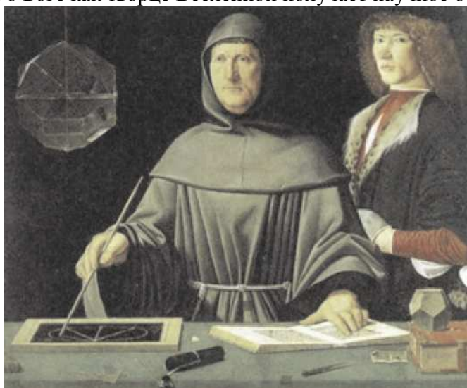
Картина Якопо де Барбари «Лука Пачоли»

Пачоли не случайно вводит в название своего трактата термин «божественный». Книга «Божественная пропорция» является одним из первых математических сочинений, в котором христианская доктрина о Боге как творце Вселенной получает научное обоснование.